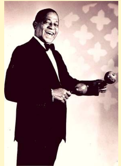
Antonio Machín (1903-1977)

A l'estètica retro del cabaret, li hem afegit el pebre picant del sacrilegi. Que Machín ens perdoni!