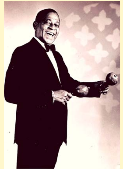
Antonio Machín (1903-1977)

La retòrica amorosa i dramàtica dels tangos i boleros s'ha integrat en el context d'una divertida sàtira religiosa. Si bé l'esperit de l'obra és irreverent, no es perd mai un respecte escrupolós per la interpretació musical. El pretext narratiu és la celebració d'una cerimònia, entre catòlica i pagana, que donarà peu a un seguit d'escenes hilarants inspirades en el vodevil o les variétés. A l'estètica retro del cabaret, li hem afegit el pebre picant del sacrilegi. Que Machín ens perdoni!